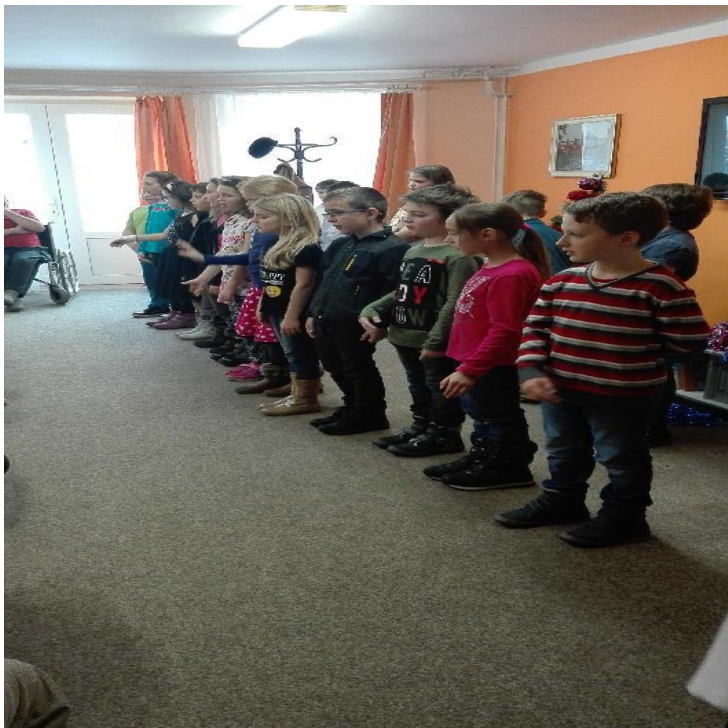
Žáci ZŠ T.G. Masaryka – „Vánoční besídka“