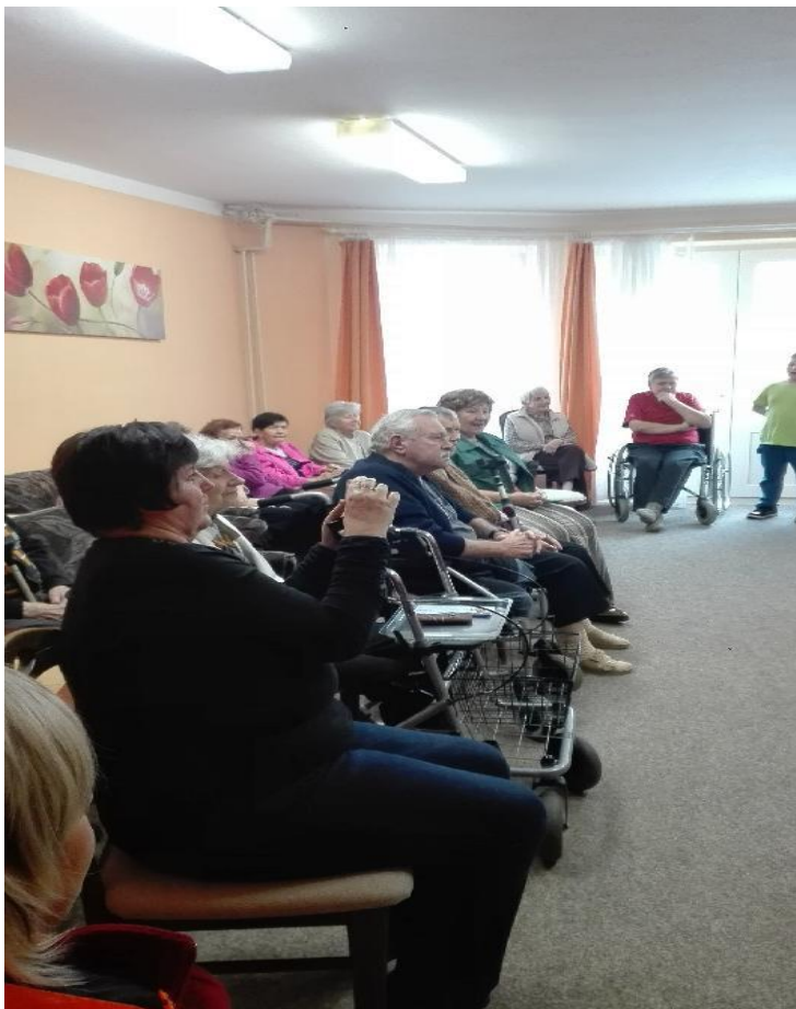
CDS – klienti PS KH z DPS na vánoční besídce